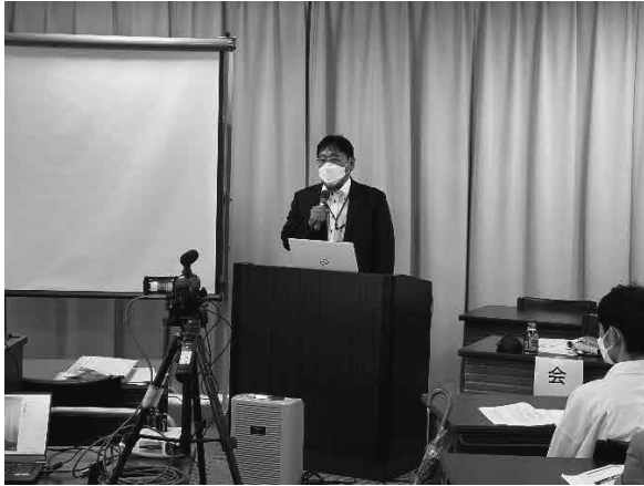
田中会長よりあいさつ