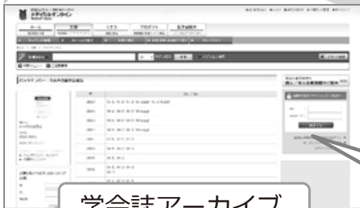
学会誌アーカイブ

① 雑誌名URL: http://mol.medicalonline.jp/ ..... インターネット上で雑誌名URLにアクセスすると、 メディカルオンライン掲載中の貴学会誌アーカイブが 表示されます。