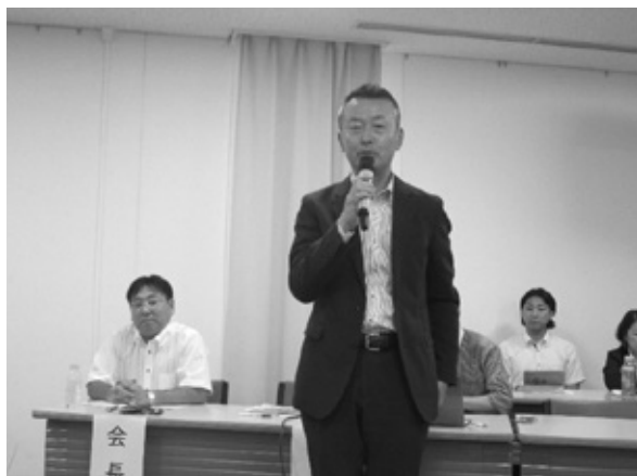
堀江副会長「閉会の辞」