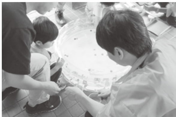
スーパーボールすくい