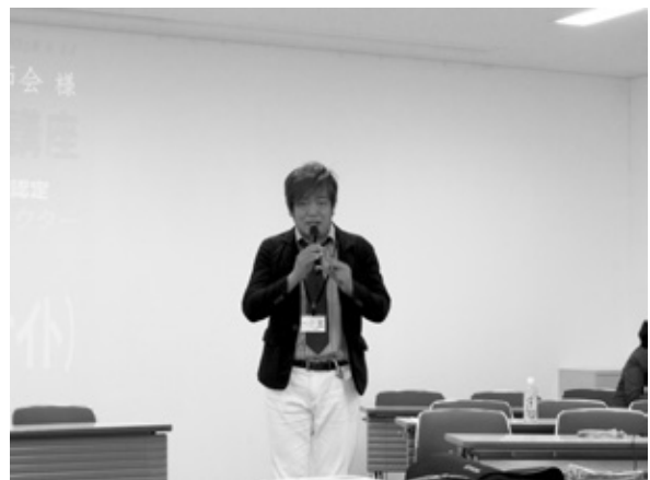
特別講演「ヤセ騎士 (ナイト)」