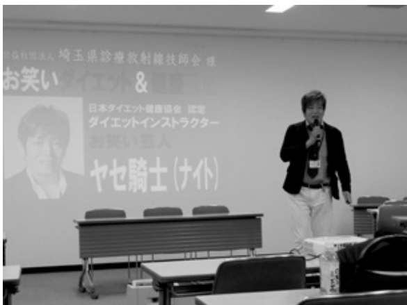
特別講演「ヤセ騎士 (ナイト)」