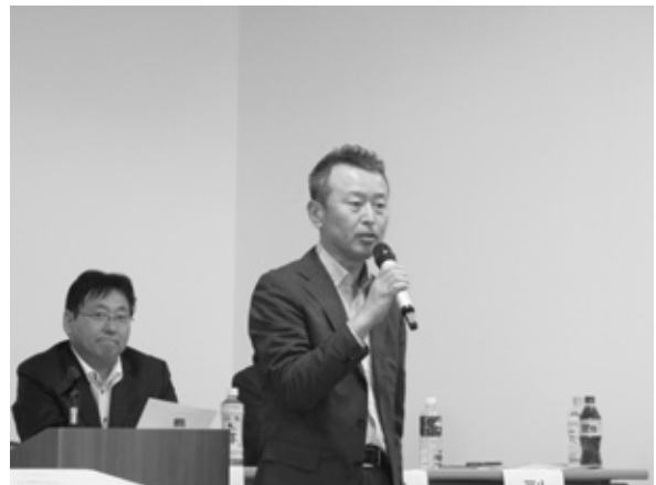
堀江副会長 閉会の辞