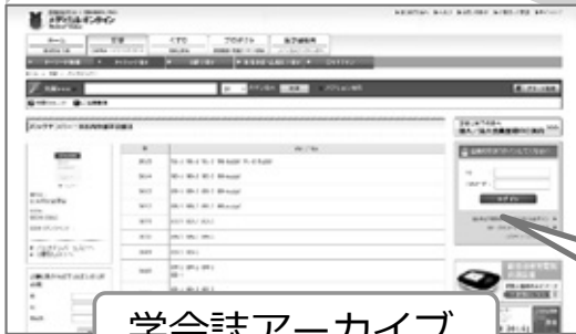
学会誌アーカイブ

学会誌無料閲覧サービスにお申込みいただきありがとうございます。 閲覧方法(手順)について、ご説明させていただきます。