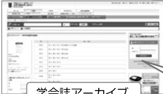
学会誌アーカイブ

学会誌無料閲覧サービスにお申込みいただきありがとうございます。 閲覧方法(手順)について、ご説明させていただきます。