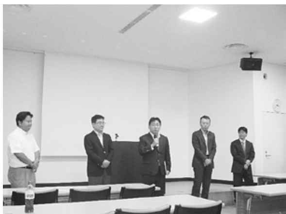
新任役員 あいさつ