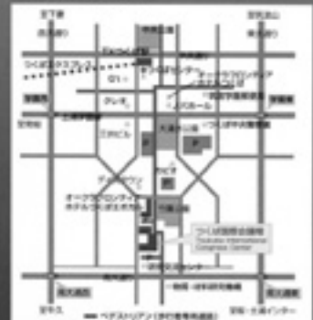
会場へのアクセス

秋葉原より快速で45分 つくば国際会議場 (エポカルつくば) つくばエクスプレス TXつくば駅より徒歩10分