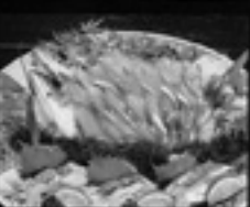
東アジア・関サバ