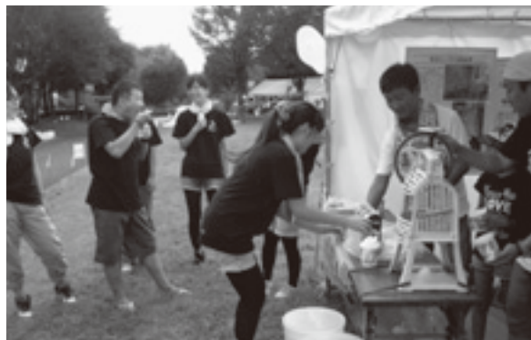
(“かき氷はいかがですか”チャリティー活動もがんばりました)