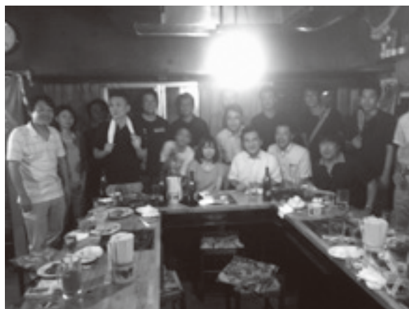
<ホルモン高砂にて>