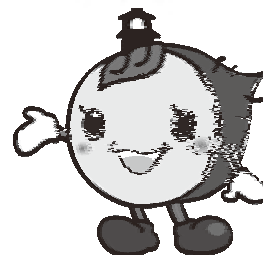
川越市マスコットキャラクター

日時 平成23年11月6日(日) 10時～14時 (オープニングイベント 9時40分～10時) 場所 川越市総合保健センター 埼玉県川越市小ヶ谷817-1