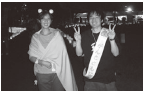
(夜もがんばって歩くぞ!)