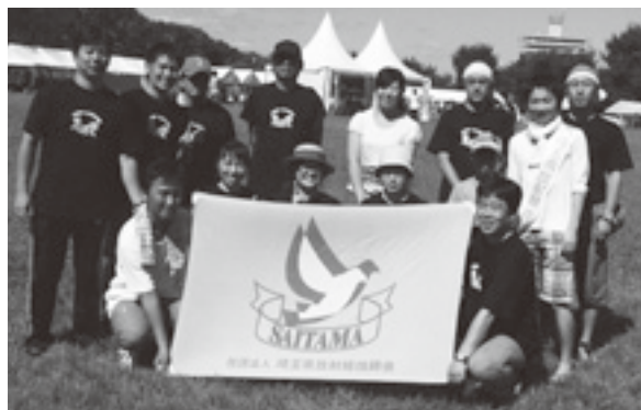
(皆さま、お疲れ様でした)