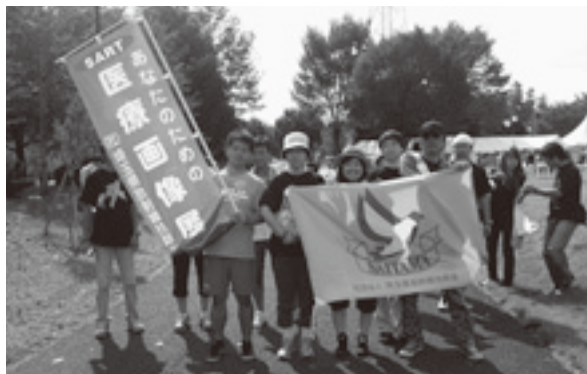
(よし!がんばって歩くぞ!)

最後に、ご協力をいただいた皆さまにこの場をお借りしてお礼を申し上げます。ありがとうございました。