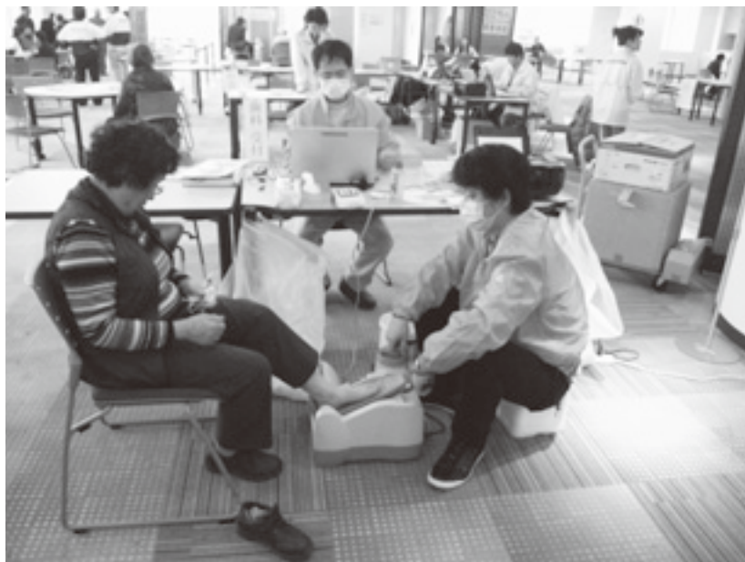
「わくわく☆さいたま☆いきいき祭り」にて骨密度測定