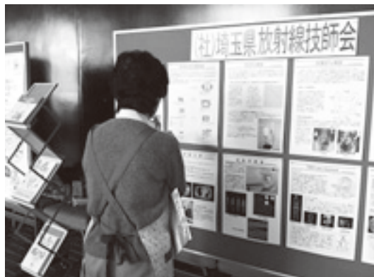
(社) 埼玉県放射線技師会ブース