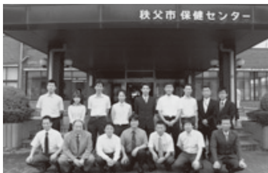
第14回秩父保健センターまつり実行委員